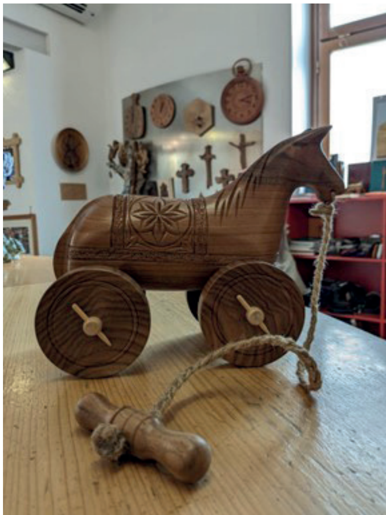
Fig. 3. Il tata