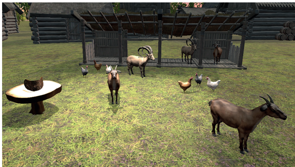
Fig. 2. Lo screenshot mostra la zona dell'ambiente in Realtà Virtuale dedicata al collare per capra