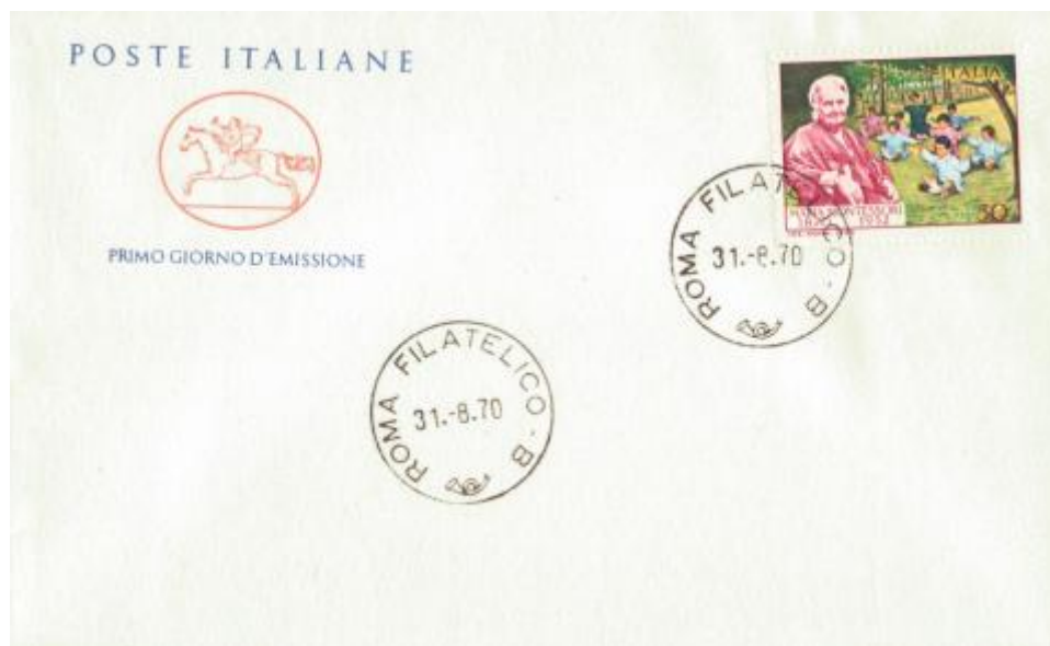
FIG. 2 - Cavallino, emittente Poste italiane, annullo filatelico Roma, non viaggiato. MM - CpB