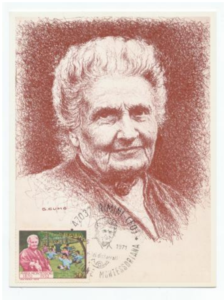
FIG. 7 - Maximum card realizzata in occasione della celebrazione montessoriana tenutesi dal 8-16 maggio 1970 a Rimini, annullo speciale Rimini, non viaggiata. MM - CpB