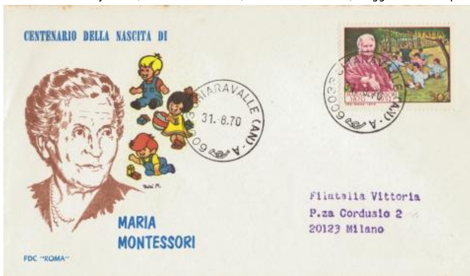
FIG. 4 - First day cover, emittente Roma, annullo Chiaravalle, viaggiata. MM - CpB