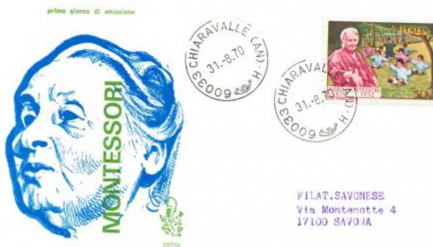
FIG. 3 - First day cover, emittente Venetia, annullo Chiaravalle, viaggiata. MM - CpB