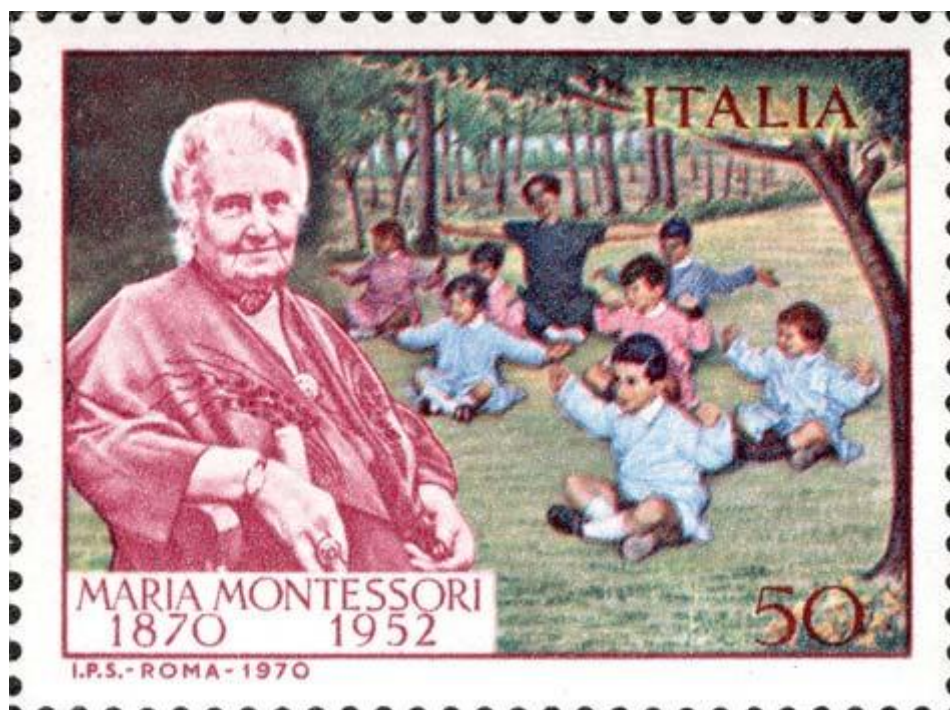
FIG. 1 - Francobollo commemorativo di Maria Montessori nel centenario della sua nascita